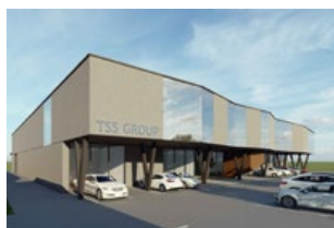
Dubnica nad Váhom