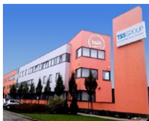
Dubnica nad Váhom