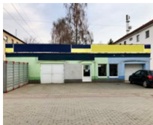
Dubnica nad Váhom